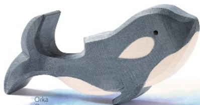
Orka Orque H 9 cm Nr. 23002