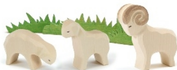
Schaf fressend Sheep eating Mouton broutant H 6 cm Nr. 11603