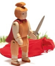
St. Martin H 16 cm Nr. 37911

Knights and Castles | Chevaliers et châteaux