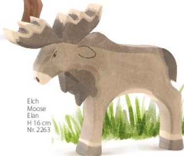
Elch Moose Élan H 16 cm Nr. 2263