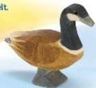
Kanadagans stehend Canada Goose standing Oie canadienne H 7 cm - Nr. 22701