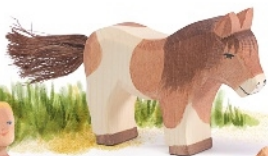
Shetland Pony stehend Shetland Pony standing Poney Shetland H 6,8 cm · Nr. 11303