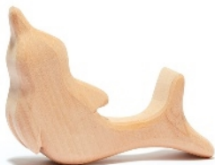
Naturholz Delfin Natural Wood Dolphin Dauphin bois naturel B 9,5 cm Nr.00570