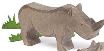
Nashorn Rhino Rhinocéros H 8,5 cm Nr. 21033