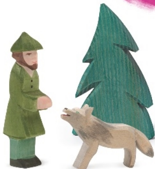
Jäger Hunter/Chasseur H 15 cm Nr. 25301