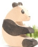
Panda sitzend Panda Bear sitting Panda assis H 10,5 cm Nr. 2192