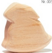
Naturholz Schaukelhase Natural Wood Rocking Rabbit Lapin à bascule bois naturel H 7 cm - Nr.00530