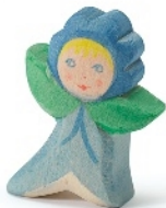
Blumenkind Vergiss mein nicht Flower Child Forget-me-not Enfant-fleur myosotis H 5,8 cm Nr. 24813