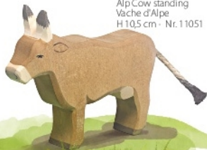
Almkuh stehend Alp Cow standing Vache d'Alpe H 10,5 cm - Nr. 11051