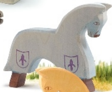
Turnierpferd blau Horse for Knight blue Cheval de tournoi bleu H 13 cm Nr. 2758