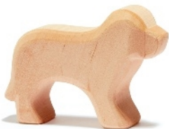
Naturholz Hund Natural Wood Dog Chien bois naturel H 7 cm - Nr.00520

Naturbelassen und besonders rund geschliffen, lassen Osteimer Greiflinge die warme Wirkung des Eichenholzes mit allen Sinnen erleben.