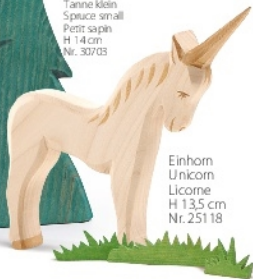
Einhorn Unicorn Licorne H 13,5 cm Nr. 25118