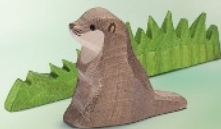
Seeotter klein Sea Otter small Petite loutre de mer H 4 cm - L 4 cm Nr. 16279