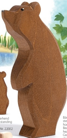
Bär groß stehend Kopf hoch Bear standing head high Grand ours tête dressée H 15,5 cm Nr. 22005