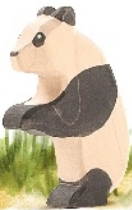
Panda tanzend Panda Bear standing Panda danseur H 13 cm Nr. 2193