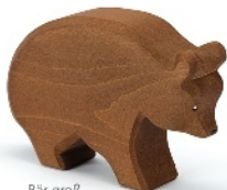
Bär groß Bear Grand ours H 8,5 cm Nr. 22001