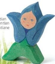
Blumenkind Enzian Flower Child Gentian Enfant-fleur gentiane H 7 cm Nr. 24815