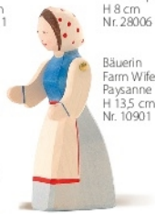
Bäuerin Farm Wife Paysanne H 13,5 cm Nr. 10901