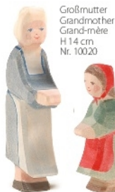
Großmutter Grandmother Grand-mère H 14 cm Nr. 10020