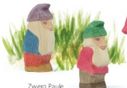
Zwerg Paule Dwarf Paule Nain Paule H 76 cm Nr. 25072