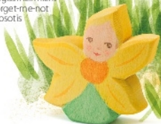
Blumenkind Sonnenblume Flower Child Sunflower Enfant-fleur tournesol H 6,4 cm Nr. 24816