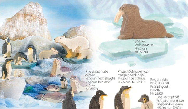
Walross Walrus/Morse H 8,5 cm Nr. 22590