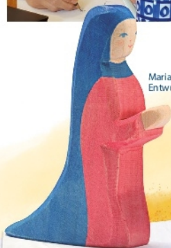
Maria der zweiten Ostheimer Krippe, Entwurf Stephan Zech 2008

Es dauert lange, bis aus der ersten Skizze eines neuen Entwurfs über viele Versionen in Holz schließlich eine wunderschöne neue Figur entsteht