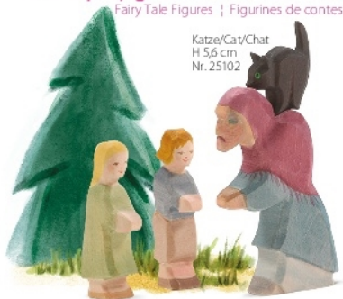
Katze/Cat/Chat H 5,6 cm Nr. 25102