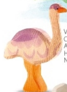
Vogel Strauß Ostrich Autruche H 10 cm Nr. 2053