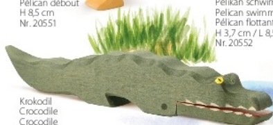
Krokodil Crocodile Crocodile L 24,5 cm - Nr. 2103