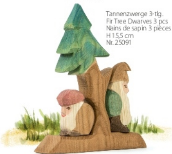
Tannenzwerg 3-tlg. Fir Tree Dwarves 3 pcs Nains de sapin 3 pièces H 15,5 cm Nr. 25091