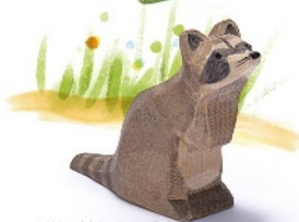
Waschbär sitzend Raccoon sitting Raton laveur assis H 6 cm - L 9 cm Nr. 16271

Die meisten Ostheimer Figuren werden aus Ahornholz gemacht. Sein helles Holz ist zart gemasert und lässt die Farben der Spielzeuge leuchten.