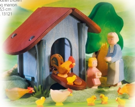
Hühnerhaus (ohne Figuren) Hen House (without figures) Poulailler (sans figurines) 23 x 17 x 21 cm Nr. 3520