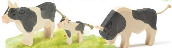
Kuh schwarz stehend Cow b&w standing Vache noire H 11,5 cm - Nr. 11042