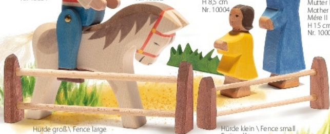
Hürde klein \ Fence small Petite clôture H 5,5 cm L 16,5 cm Nr. 3371