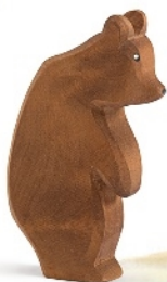
Bär groß stehend Kopf tief Bear head down Grand ours tête inclinée H 14,5 cm Nr. 22006