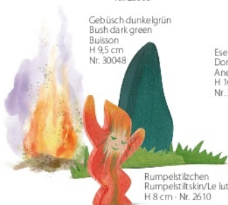
Rumpelstilzchen Rumpelstiltskin/Le lutin H 8 cm - Nr. 2610