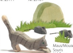
Katze springend Cat jumping Chat bondissant H 7 cm - Nr. 11402