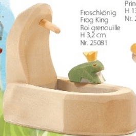
Froschkönig Frog King Roi grenouille H 3,2 cm Nr. 25081