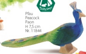
Pfau Peacock Paon H 7,5 cm Nr. 11844