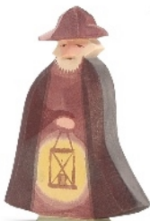
Nachtwächter Night Watchman Veilleur de nuit H 14 cm Nr. 2546