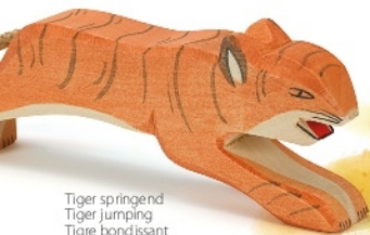
Tiger springend Tiger jumping Tigre bondissant H 6,5 cm Nr. 20101