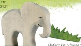
Elefant klein fressend Elephant small eating Éléphant petit broutant H 8,5 cm Nr. 20423