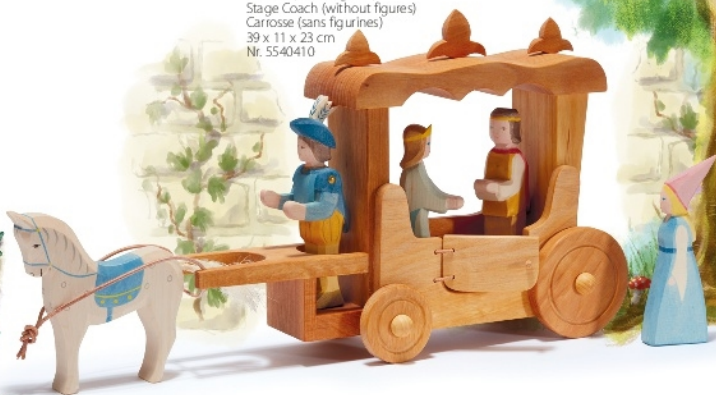
Karosse (ohne Figuren) Stage Coach (without figures) Carrrosse (sans figurines) 39 x 11 x 23 cm Nr. 5540410