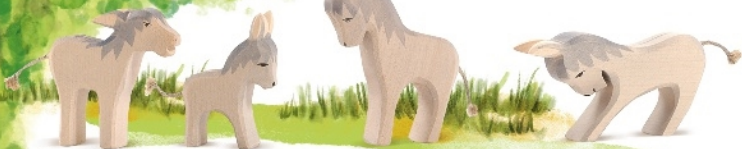
Esel störrisch Donkey angry Ane brayant H 9 cm Nr. 11204