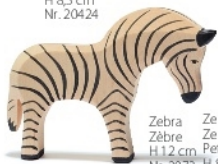
Zebra Zèbre H 12 cm Nr. 2073