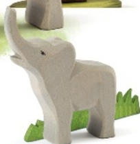
Elefant klein trompetend Elephant small trumpeting Éléphant petit barrissant H 13 cm Nr. 20422