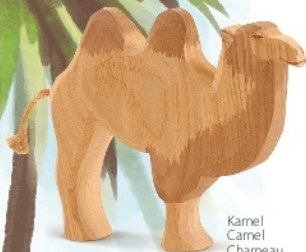
Kamel Camel Chameau H 13,5 cm Nr. 20901