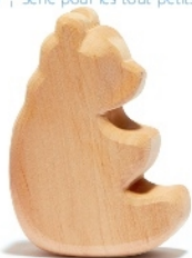
Naturholz Schaukelbär Natural Wood Rocking Bear Ours à bascule bois naturel H 9,5 cm Nr.00550