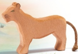
Löwin Lion female Lionne H 11 cm Nr. 20002