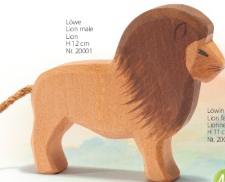
Löwe Lion male Lion H 12 cm Nr. 20001