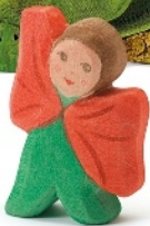
Blumenkind Mohn Flower Child Poppy Enfant-fleur coquelicot H 6,5 cm Nr. 24812