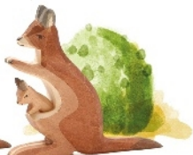
Känguru mit Kind (4 cm) Kangaroo with Baby (4 cm) Kangourou avec son bébé (4 cm) H 11,5 cm Nr. 2062