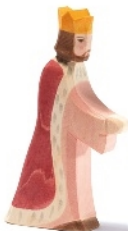
König King/Roi H 16 cm Nr. 25001