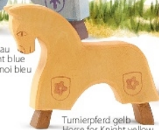
Turnierpferd gelb Horse for Knight yellow Cheval de tournoi jaune H 13 cm Nr. 2759