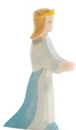
Prinzessin Princess Princesse H 13,5 cm Nr. 25007