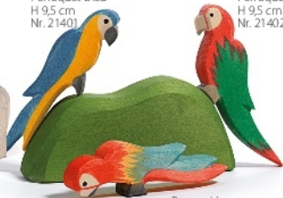
Papagei bunt Parrot multicolor Perroquet multicolore H 9 cm Nr. 21403