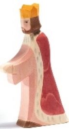
König King/Roi H 16 cm Nr. 25001