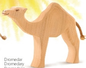
Dromedar Dromedary Dromadaire H 12,5 cm Nr. 20911