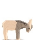
Kleine Ziege Little Goat Petite chèvre H 5 cm Nr. 11713

Unsere Holzfiguren lassen Kinder kreativ werden. Begeistert schaffen sie bei Kindergeburtstagen oder Führungen ihre ganz individuell bemalten Figuren.