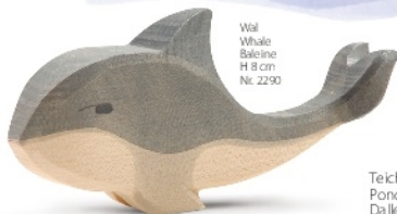
Wal Whale Baleine H 8 cm Nr. 2290