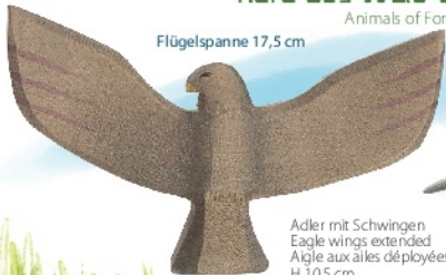
Adler mit Schwingen Eagle wings extended Aigle aux ailes déployées H 10,5 cm Nr. 1713