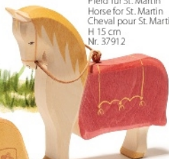
Pferd für St. Martin Horse for St. Martin Cheval pour St. Martin H 15 cm Nr. 37912