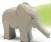
Elefant klein Rüssel gestreckt Elephant small trunk out Éléphant petit trompe en avant H 8,5 cm Nr. 20424