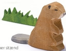
Biber sitzend Beaver sitting Castor H 5,5 cm - L 7 cm Nr. 16266