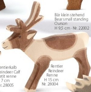
Rentier Reindeer Renne H 15 cm Nr. 28004