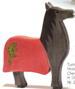
Pferd Schwarzer Ritter Horse Black Knight Cheval pour Chevalier noir H 18 cm Nr. 27701

Ritter stehend rot Knight standing red Chevalier rouge H 17 cm Nr. 2741