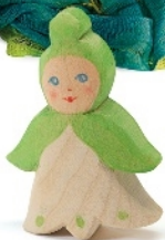
Blumenkind Märzenbecher Flower Child Snowflake Enfant-fleur claudinette H 7,1 cm Nr. 24814