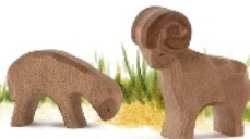
Schaf braun fressend Sheep brown eating Mouton brun broutant H 6 cm · Nr. 11653