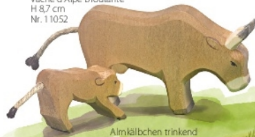
Almkälbchen trinkend Alp Calf drinking Veau d'Alpe tétant H 4 cm - Nr. 11055