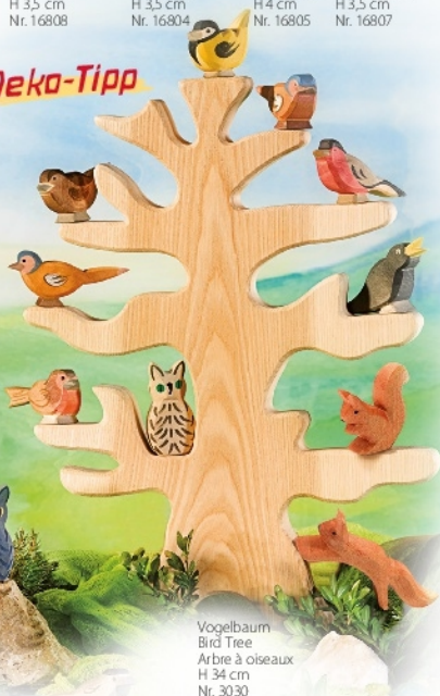
Vogelbaum Bird Tree Arbre à oiseaux H 34 cm Nr. 3030