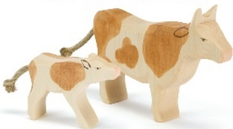
Kalb braun trinkend Calf brown drinking Veau marron tétant H 6,5 cm Nr. 11025