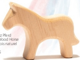
Naturholz Pferd Natural Wood Horse Cheval bois naturel H 8,5 cm Nr.00525