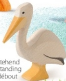
Pelikan stehend Pelican standing Pélican debout H 8,5 cm Nr. 20551