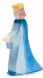
Königin Queen/Reine H 15,5 cm Nr. 25003