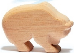
Naturholz Bär laufend Natural Wood Bear running Ours courant bois naturel H 7 cm - Nr.00555