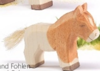
Shetland Fohlen Shetland Colt Shetland poulain H 5 cm Nr. 11305