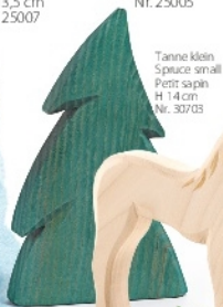
Tanne klein Spruce small Petit sapin H 14 cm Nr. 30703