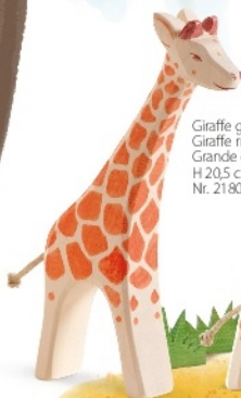
Giraffe groß laufend Giraffe running Grande girafe courante H 20,5 cm Nr. 21802