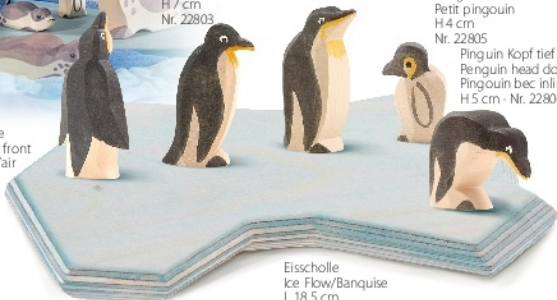
Eisscholle Ice Flow/Banquise L 18,5 cm Nr. 2258