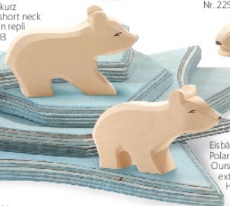
Eisbär klein Hals lang Polar Bear small long neck Oursion polaire en extension H 5,5 cm Nr. 22102