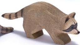
Waschbär laufend Raccoon running Raton laveur courant H 4,2 cm - L 11 cm Nr. 16272