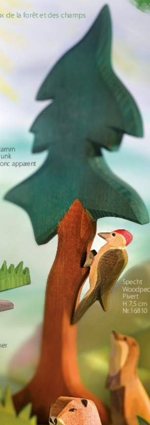
Specht Woodpecker Pivert H 7,5 cm Nr. 16810