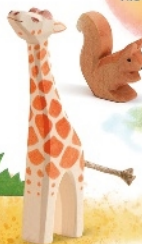
Giraffe klein Kopf hoch Giraffe small head high Girafon tête dressée H 14,5 cm Nr. 21803

Einige Ostheimer Figuren, wie z.B. die Kamele, sind aus dem festen, stark gema- serten Eschenholz gemacht. Hier kann man die Holzstruktur besonders gut sehen.