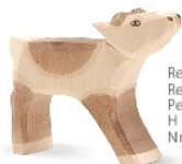
Rentierkalb Reindeer Calf Petit renne H 7 cm Nr. 28005