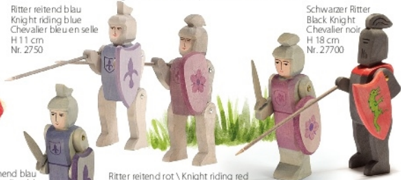
Schwarzer Ritter Black Knight Chevalier noir H 18 cm Nr. 27700

Ritter stehend blau Knight standing blue Chevalier bleu H 17 cm Nr. 2740