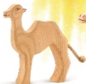
Kamel klein Camel small Petit chameau H 10 cm Nr. 20902