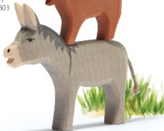
Bremer Stadtmusikanten 4-teilig Bremer Town Musicians 4 pcs Les musiciens de Brema 4 pcs H 20 cm - Nr. 2630