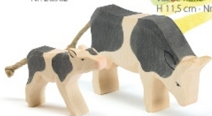
Kalb schwarz trinkend Calf b&w drinking Veau noir tétant H 6,5 cm - Nr. 11045