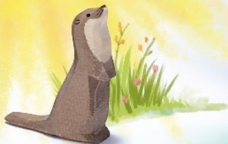
Seeotter stehend Sea Otter standing Loutre de mer debout H 7 cm - L 6 cm Nr. 16276