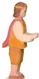
Prinz Prince H 14,5 cm Nr. 25005