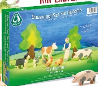
Bauernhof Set mit Diorama 8-teilig Farm Set with Diorama 8 pieces Ensemble de ferme avec diorama 8 pièces Nr. 60303